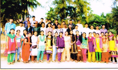
सहल: कॉमर्स विभाग