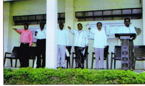
संविधान दिन: शपथ देताना संस्थेचे अध्यक्ष मा. जे.डी.आंबरे पार्टील