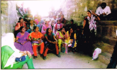
सहल: मराठी विभाग