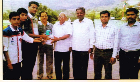
सहल: केळुंगण वृध्दाश्रम भेट