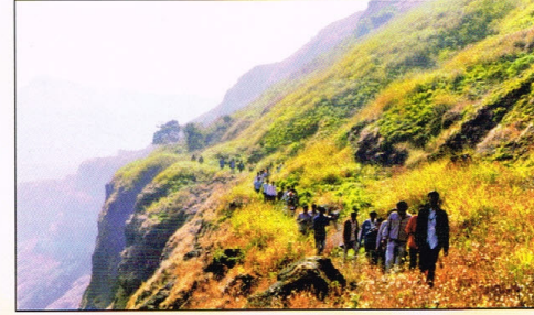
रतनगडाच्या एका अवघड वाटेवर...