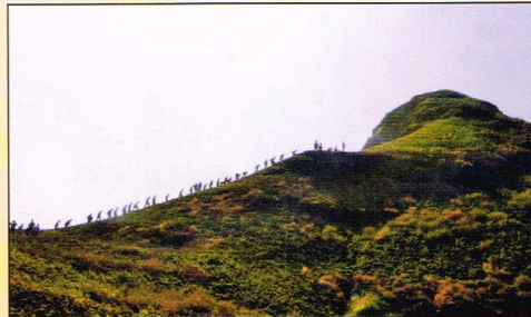
रतनगडाच्या चढणीतील एक टप्पा पार करतांना शिबिरार्थी