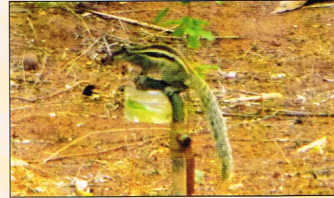
पर्यावरण: तीव्र उन्हाळ्यात कृत्रिम पाणीसाठ्यातील पाणी पिऊन आपली तहान भागवताना