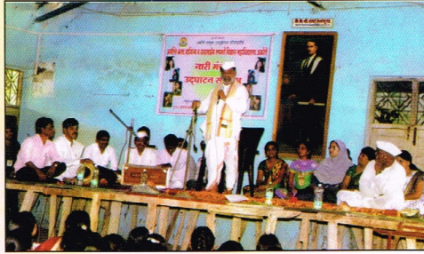
नारी मंच उद्घाटन समारंभ: विद्यार्थिनींना प्रबोधन करताना ह.भ.प. वाबळे महाराज