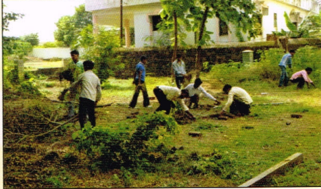
महाविद्यालय परिसर स्वच्छतेचे काम करताना कमवा व शिका योजनेतील विद्यार्थी