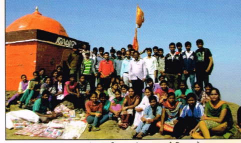
सहल: वनस्पतीशास्त्र विभागाची कळमुबाई शिखर भेट