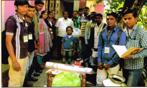
नर्मदा प्रकल्पग्रस्तांना अकोले शहरातून गृहउपयोगी साहित्याची मदत