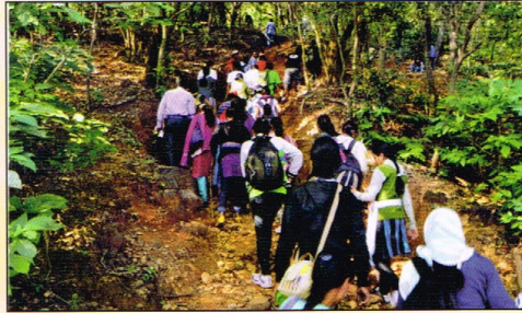
गिर्यारोहणात सहभागी शिबिरार्थी