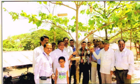
पर्यावरण: महाविद्यालय परिसरात कडक उन्हाळ्यात पक्ष्यांसाठी अन्न, निवारा व पाण्याची सोय